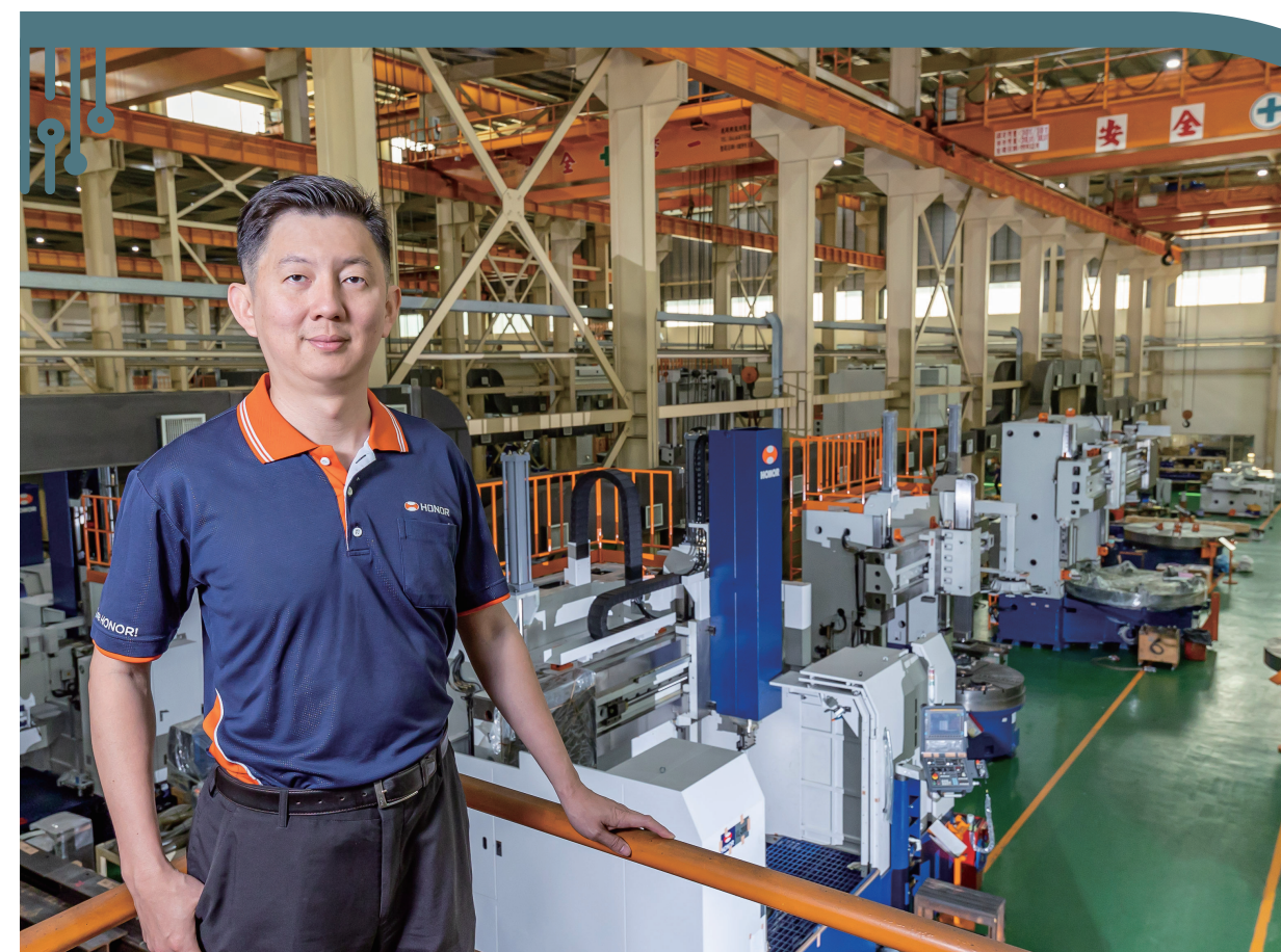
榮田精機一直致力於提供創新且高品質的機械設備，以應對能源轉型的挑戰。

榮田精機原本的企業發展願景是「亞洲首選高效智慧型立車策略夥伴」，如今在團隊持續討論下達成共識，改成邁向「全球首選高效智慧型立車策略夥伴」，把眼光放在挑戰業界全球前三大的目標，「要做就要做全球的標竿企業！」陳政鈞胸有成竹地這麼說。