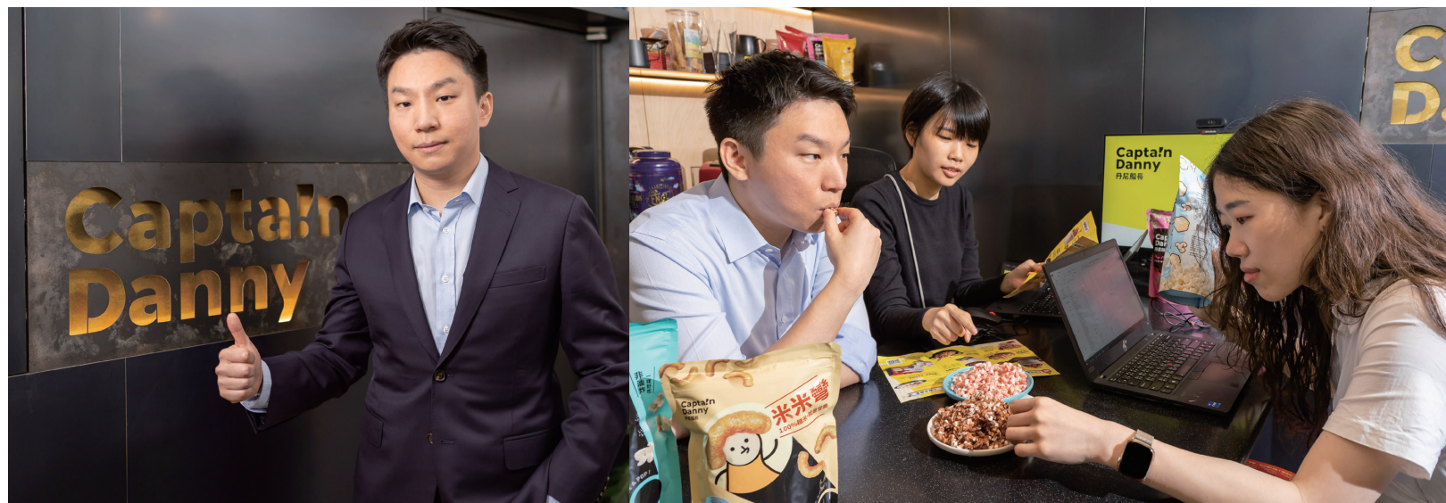
丹尼船長與團隊經歷無數次的嘗試與研發，針對消費者最在意的用油、成分等問題展開產品優化方針，只為實現「對你更好」的品牌初衷。